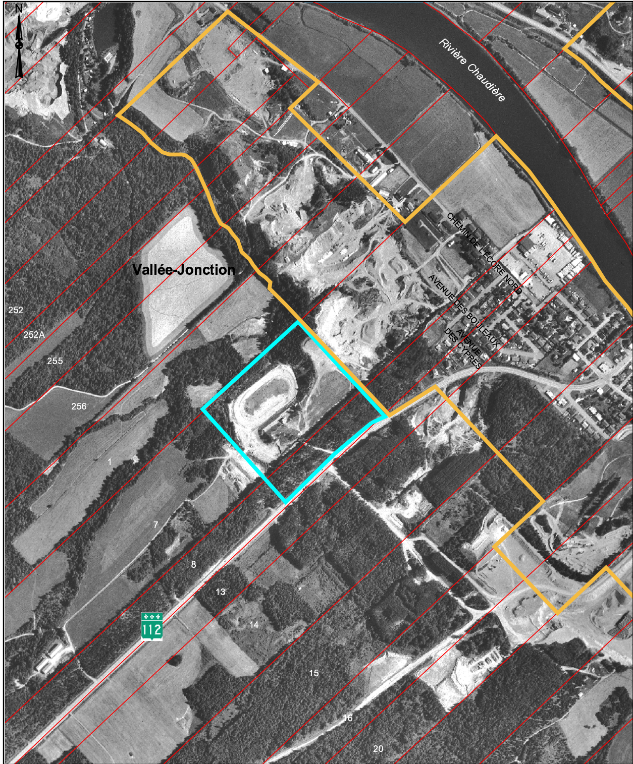
Annexe 5 Piste de course de Vallée-Jonction, contrainte anthropique